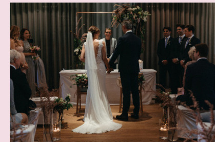
UNKITSCHIG | unkitschig.com