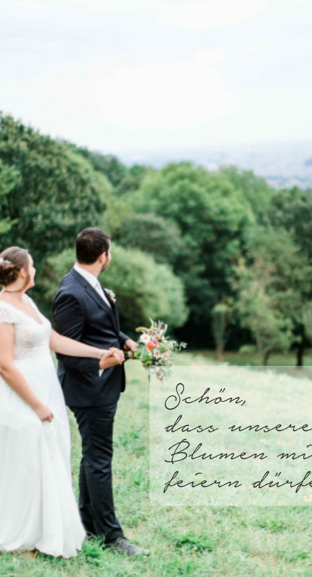
DENISE KERSTIN | hochzeitsfotografin-wien.at