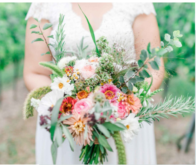
DENISE KERSTIN | hochzeitsfotografin-wien.at